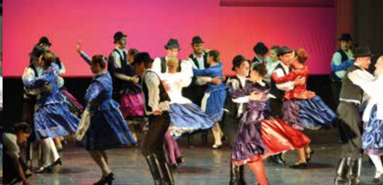
HÁRMASFONAT Nagyvárad - ROMANIA