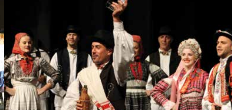
Centar Tradicijske kulture Varaždin - CROAZIA

Il gruppo folkloristico 'Balarins di Buje maestra Emma Pauluzzo' nasce nel 1967 a Buja, nell'area collinare del Friuli Venezia Giulia, regione di confine situata nell'angolo Nord Est dell'Italia, al confine con Austria e Slovenia, un luogo intriso di creatività, poesia e arte. A partire dal 1981 inoltre il gruppo organizza annualmente l'incontro internazionale del folklore denominato 'Butinle in Stajare - Incontro della cultura popolare europea', un appuntamento per i gruppi partecipanti, per incontrarsi e confrontare la passione per la musica e la danza popolare.