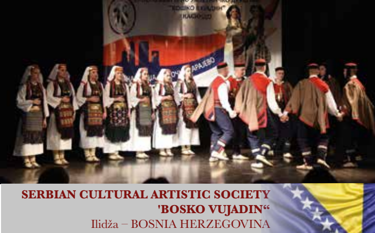
SERBIAN CULTURAL ARTISTIC SOCIETY 'BOSKO VUJADIN' Ilidža – BOSNIA HERZEGOVINA

La società artistico-culturale serba "Bosko Vujadin" ha iniziato la sua attività nel 1994 come unica istituzione culturale nella città di Ilidža, vicino a Sarajevo, che riuniva bambini e adolescenti e offriva loro attività ricreative. L'associazione organizza concerti folcloristici, spettacoli teatrali, scuole di danze moderne, ecc. Nel corso degli anni la società si è concentrata principalmente nel preservare la tradizione culturale dei serbi in Bosnia ed Erzegovina e in altri paesi in cui vivono i serbi.